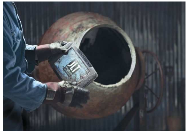
Construction - Bâtiment