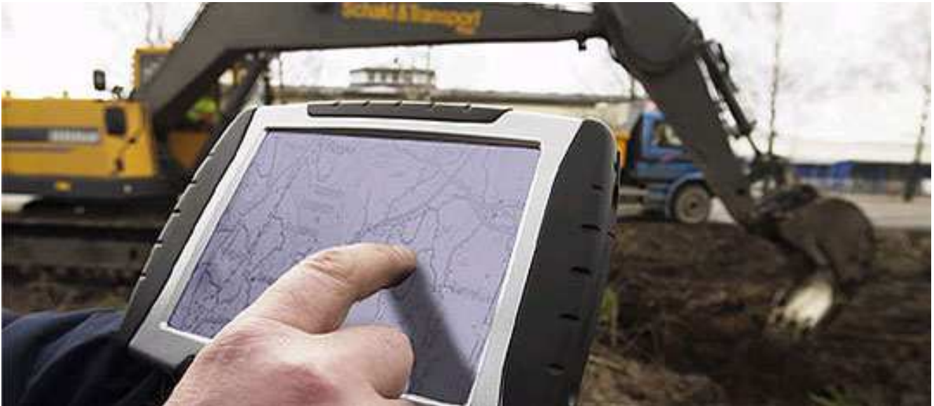
Génie Civil - Travaux Publics