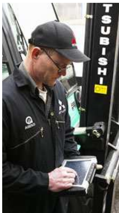
Maintenance - Manutention